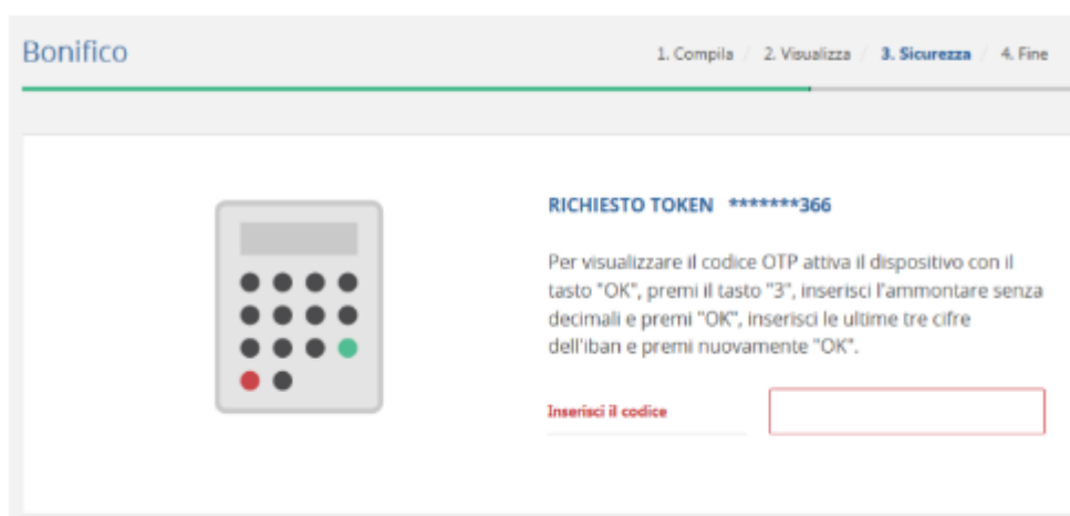
Videata di autenticazione a 2 fattori nel caso di un Bonifico